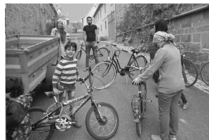
Große Freude herrschte bei drei kurdischen Familien in Enheim.

Viele großzügige Fahrradspenden gab es in den letzten Jahren. Ein herzliches Dankeschön allen Spendern! Hier eine Fahrradübergabe in Enheim. Sie sehen, Ihr Fahrrad tut weiter gute Dienste. Falls Sie noch übrige Drahtesel in der Hütte oder im Keller stehen haben, melden Sie sich, sie werden überholt und an Flüchtlinge weiter gegeben. Die Aktion geht weiter! Ein Anruf im Pfarramt Stadtkirche (Tel. 8025) genügt. Ihr Martin Nicoloy